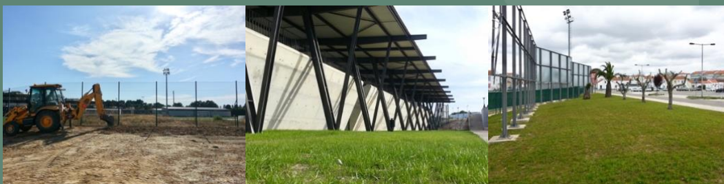
Construção de espaços verdes, propriedade municipal (Coruche, 2013)