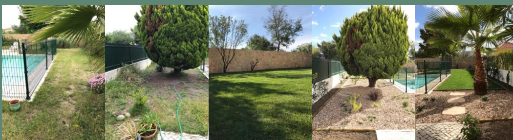
Reabilitação de espaços verdes, propriedade particular (Azeitão, 2020)