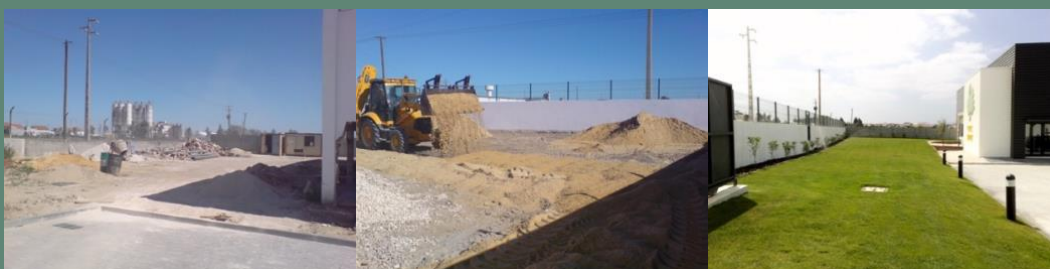
Construção de espaços verdes, unidade industrial (Montijo, 2009)