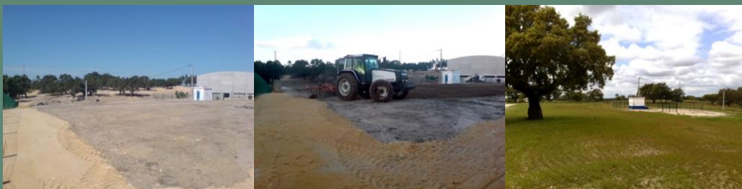
Reposição de coberto vegetal em unidade industrial (Coruche, 2009)

Apresentamos alguns dos projectos desenvolvidos no decurso da nossa actividade.