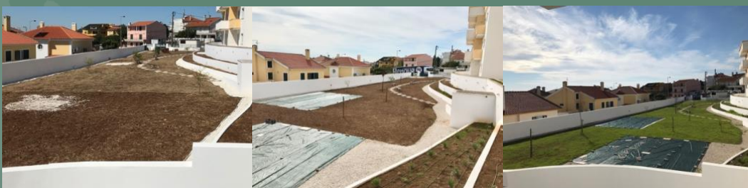
Consultoria / apoio técnico à reabilitação de espaços verdes, propriedade particular (Cascais, 2021)