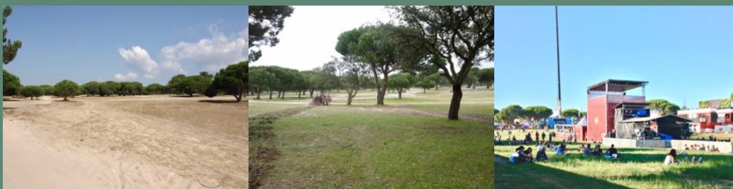
Instalação de prado no Festival SBSR – parceria com organização (Meco, 2012 e 2013)