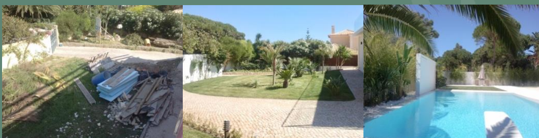
Construção de espaços verdes, propriedade particular (Cascais, 2011)